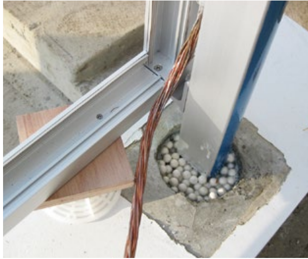
セラミックボール充填>オーバルレジン(エポキシ樹脂)注入